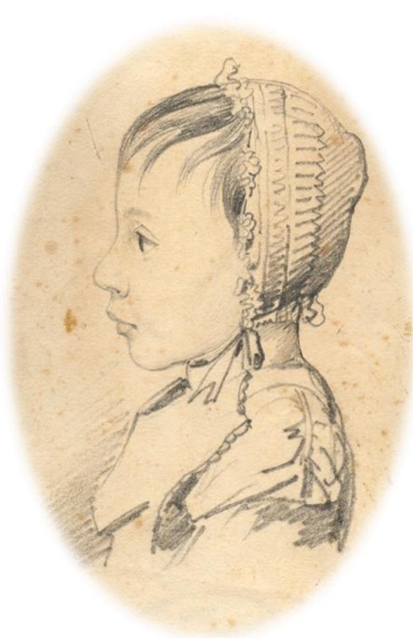
Рис. 2. Юлия Даль А.П. Сапожников